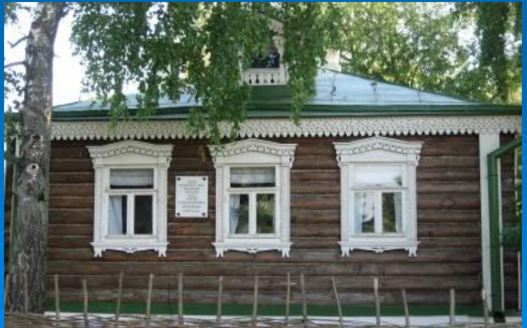
Дом родителей Есенина