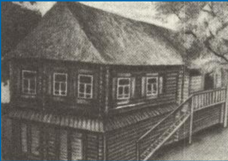
Дом родителей Есенина