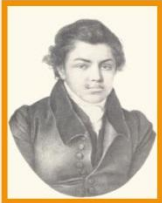
Н.М. Языков (Дерпт. 1822 г.)