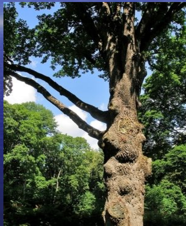
Дуб, посаженный Тургеневым

Вокруг усадебного дома на 40 гектарах разбит великолепный парк. Со времени основания парка сохранилось около 2000 вековых и двухсотлетних лип, ясеней, кленов, елей, дубов, вязов, берез, серебристых тополей