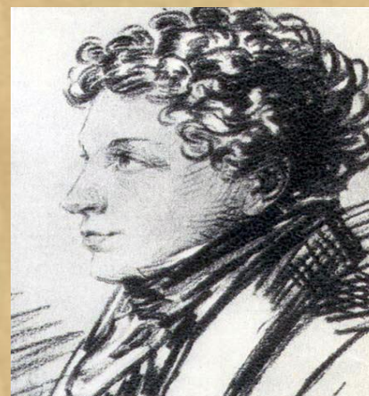
БРАТ , Лев Сергеевич Пушкин.