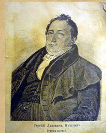
ОТЕЦ , Сергей Львович Пушкин.