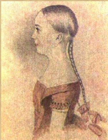
Мария Александровна Пушкина.