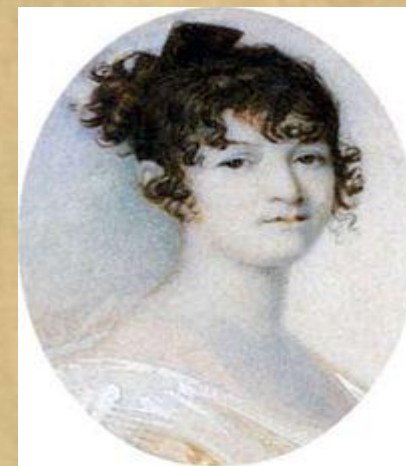
МАТЬ , Надежда Осиповна Ганнибал