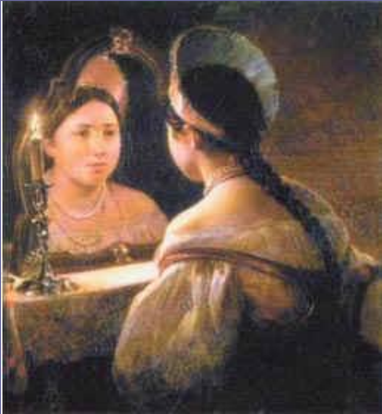
К. П. Брюллов “Гадающая Светлана”

Раз в крещенский вечерок Девушки гадали: За ворота башмачок, Сняв с ноги, бросали; Снег пололи; под окном Слушали; кормили Счетным курицу зерном; Ярый воск топили; В чашу с чистою водой Клали перстень золотой, Серьги изумрудны; Расстилали белый плат И над чашей пели в лад Песенки подблюдны.