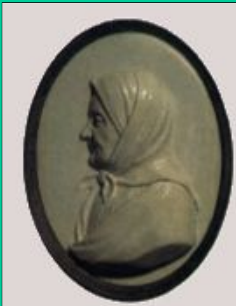
Яковлева Арина Родионовна (1758-1828)