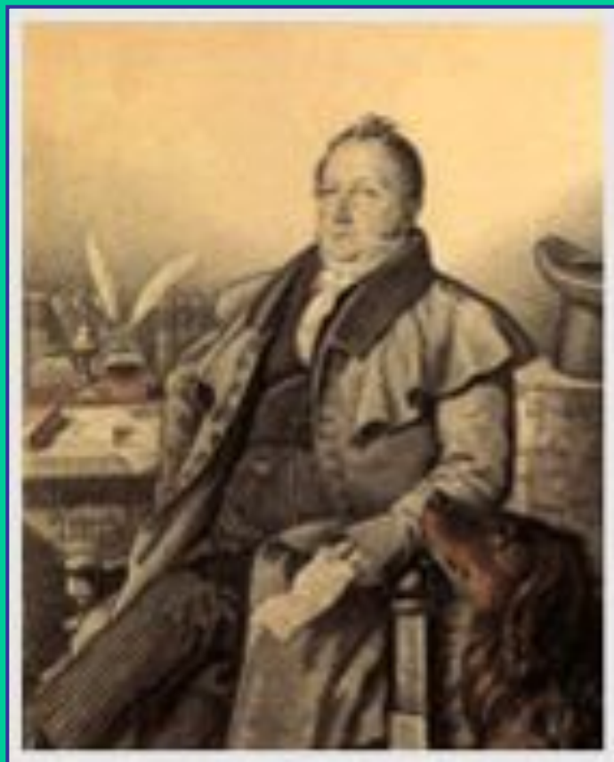
Пушкин Сергей Львович (1767-1848)