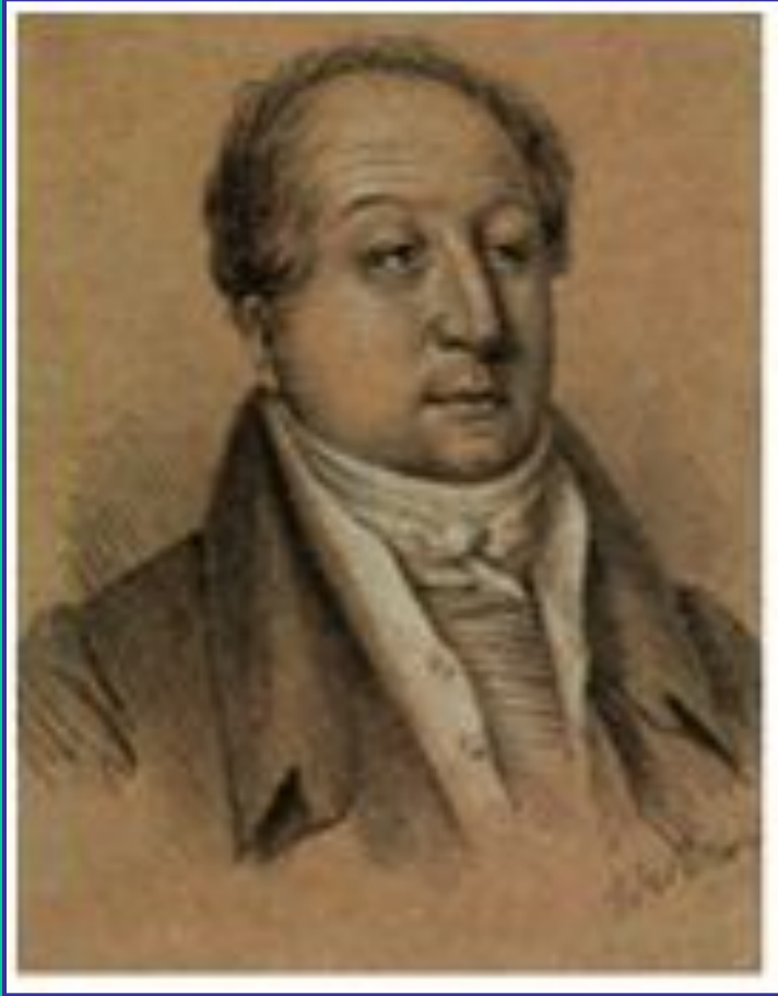
Пушкин Василий Львович (1766-1830)