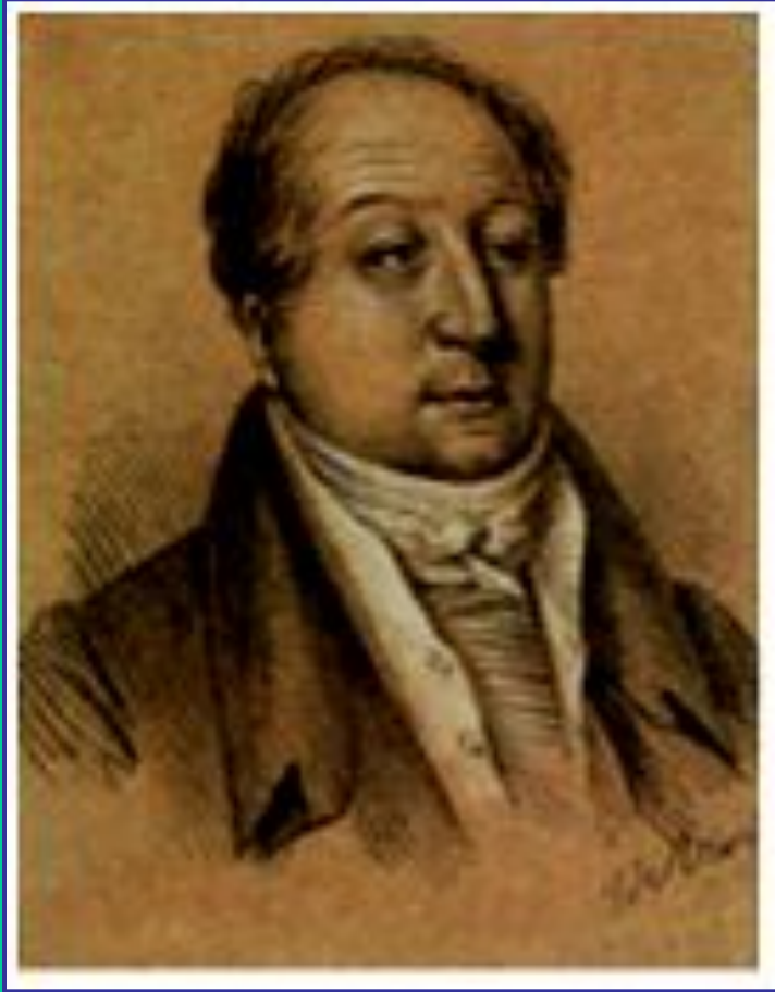
Пушкин Василий Львович (1766-1830)