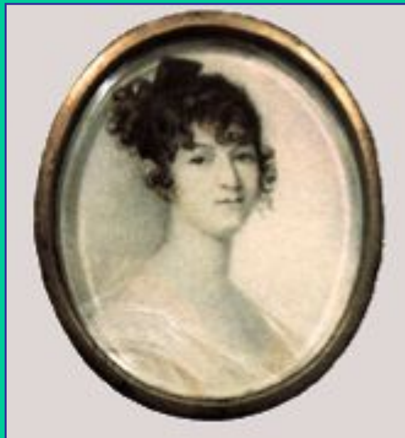
Пушкина Надежда Осиповна (1775-1836)