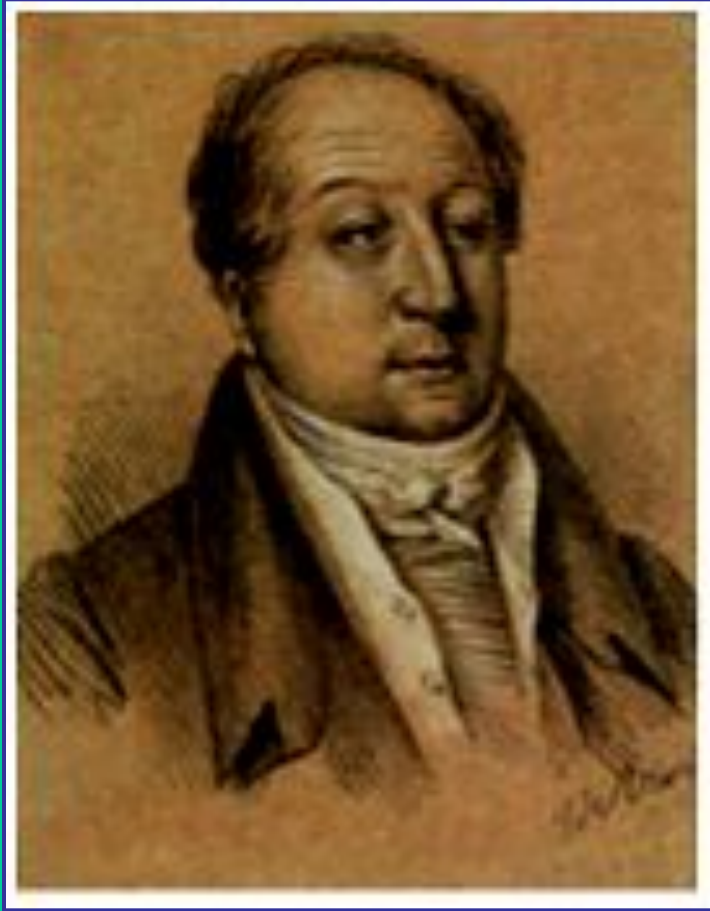
Пушкин Василий Львович (1766-1830)