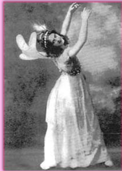
На американской танцовщице Айседоре Дункан