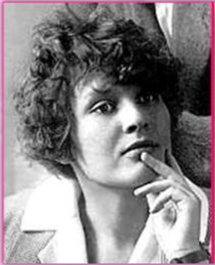
На Зинаиде Николаевне Райх