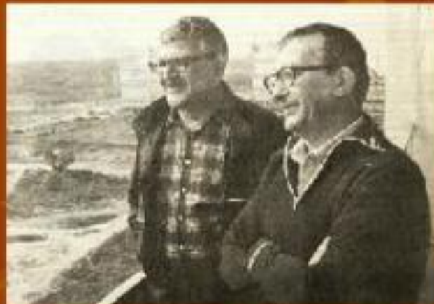
Борис и Аркадий Стругацкие