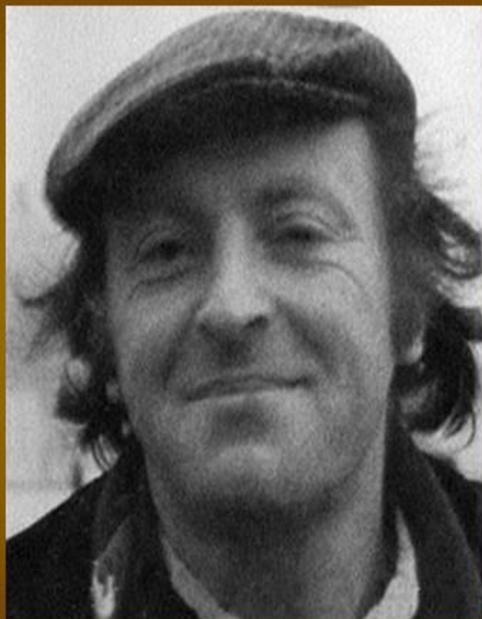
Поэт Иосиф Бродский