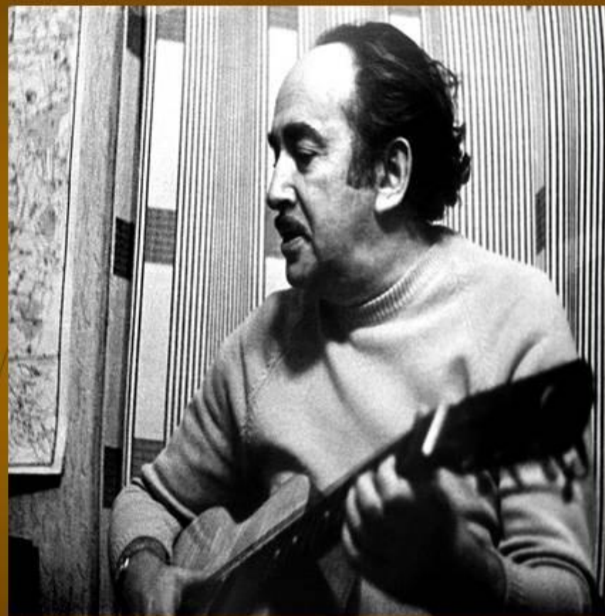
Поэт и писатель Александр Галич