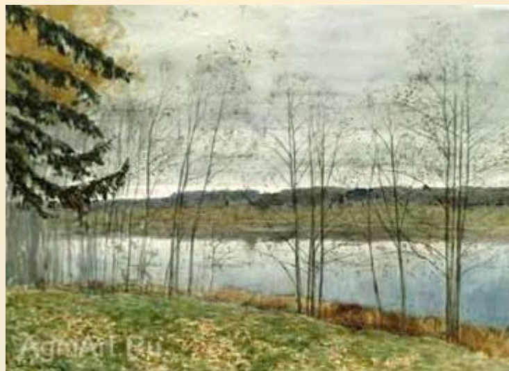
И. И. Левитан «Осень»