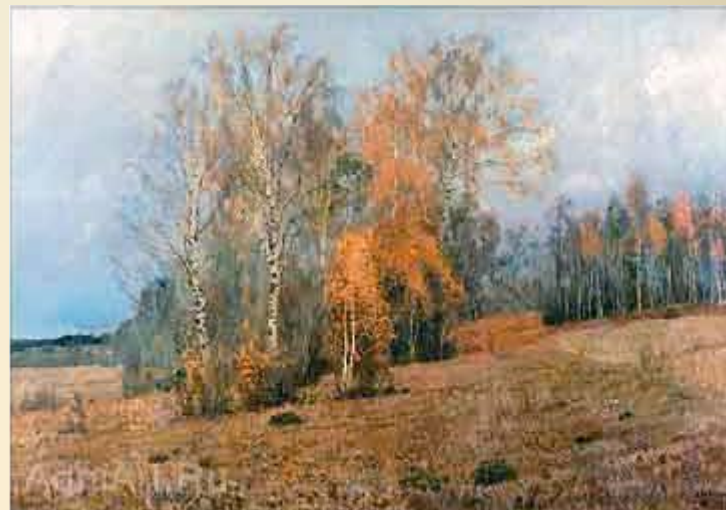
И. И. Левитан «Октябрь»