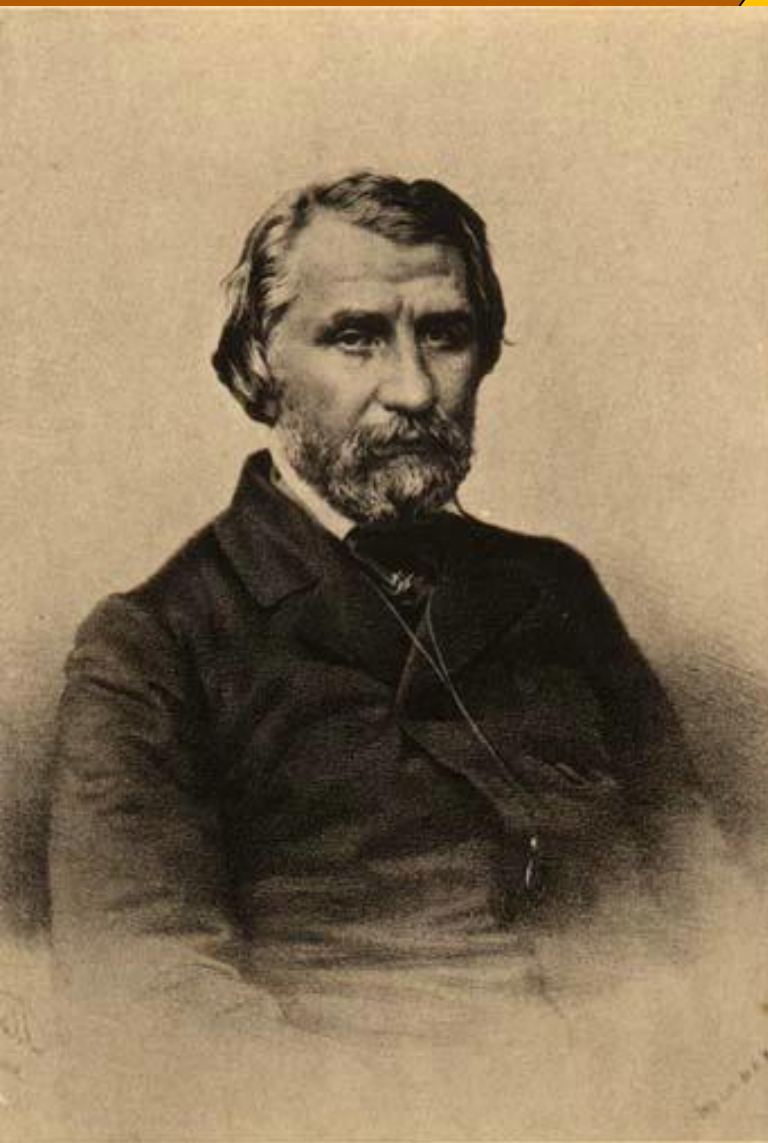
Иванъ Серг. ТУРГЕНЕВЪ. Авторъ „Записокъ охотника“. (1818—1883)