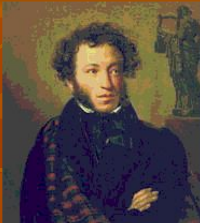
А. С. Пушкин. Портрет работы О. А. Кипренского (1827, Третьяковская галерея).