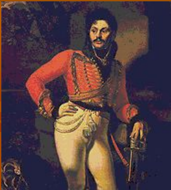
О. А. Кипренский. «Портрет лейб-гусарского полковника Евграфа Давыдова». 1809.