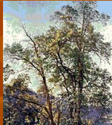
Александр Иванов. Олива. Третьяковская галерея в Москве.