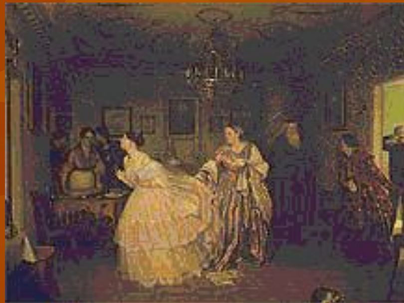
П. А. Федотов. «Сватовство майора». 1848 год. Третьяковская галерея.