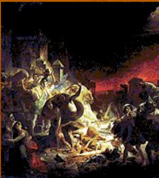
К. П. Брюллов. «Последний день Помпеи».