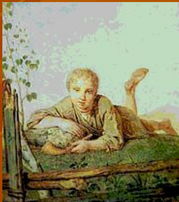
А. Г. Венецианов. «Пастушок с дудкой». 1820-е годы.