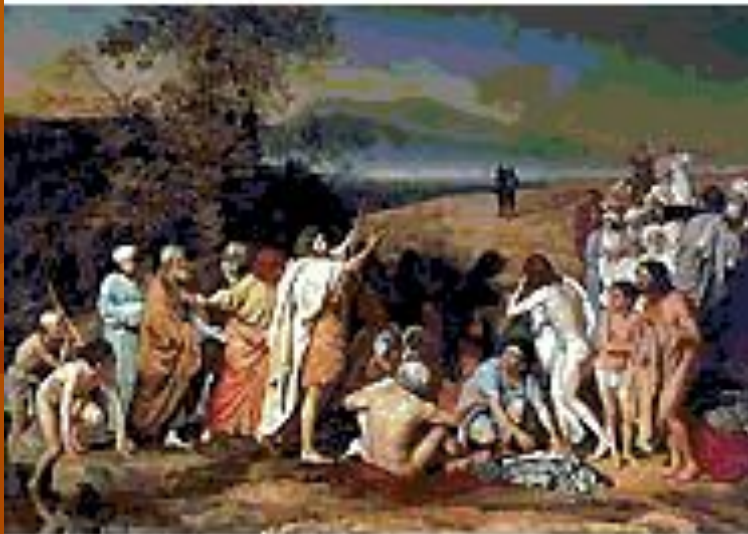
А. А. Иванов. «Явление Христа народу» (1837-57, Третьяковская галерея).