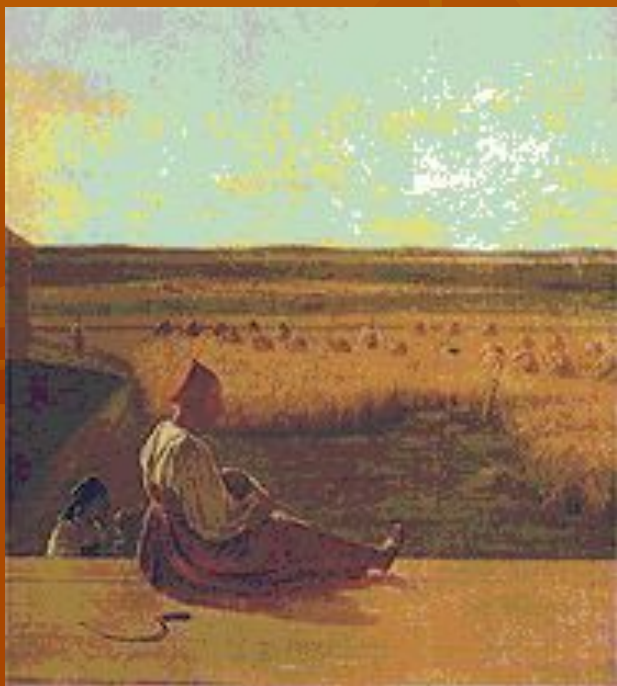
А. Г. Венецианов. «На жатве. Лето». Середина 1820-х гг.