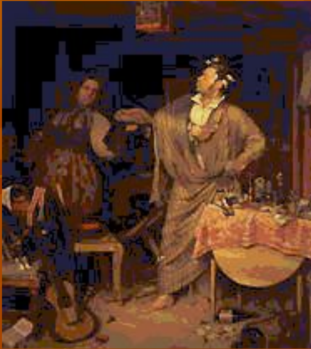
П. А. Федотов. «Свежий кавалер». 1846. Третьяковская галерея.