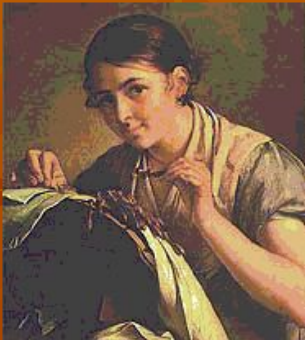
В. А. Тропинин. «Кружевница». 1823 год. Третьяковская галерея.