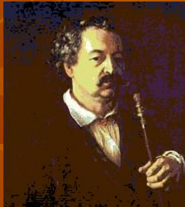
В. А. Тропинин. «Портрет неизвестного в халате с трубкой».