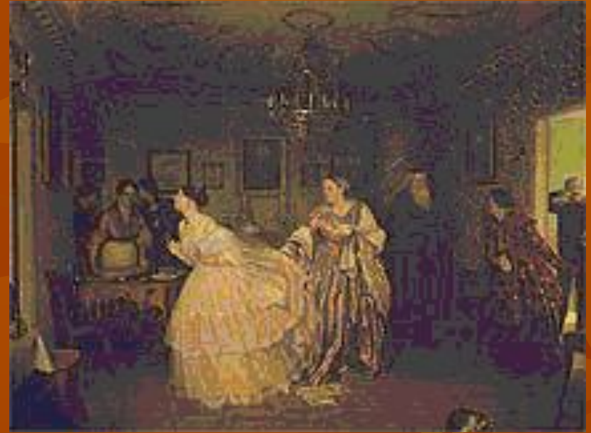
П. А. Федотов. «Сватовство майора». 1848 год. Третьяковская галерея.