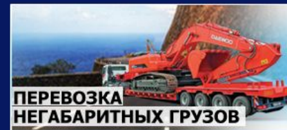
ПЕРЕВОЗКА НЕГАБАРИТНЫХ ГРУЗОВ