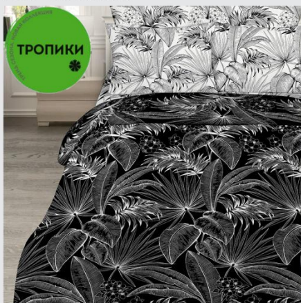
7117 «Тропики», вид 2