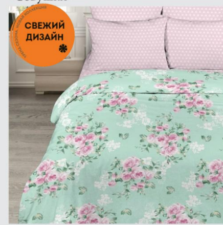
7140 «Стефания», вид 2