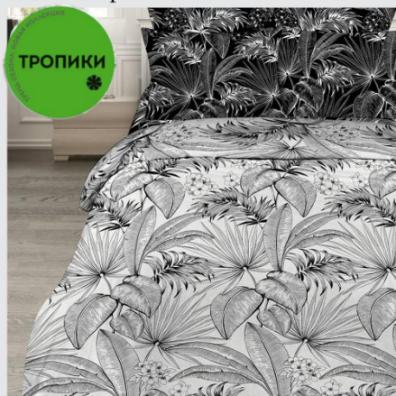
7117 «Тропики», вид 1