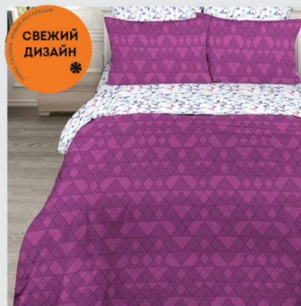
7000 «Кристалл», вид 1