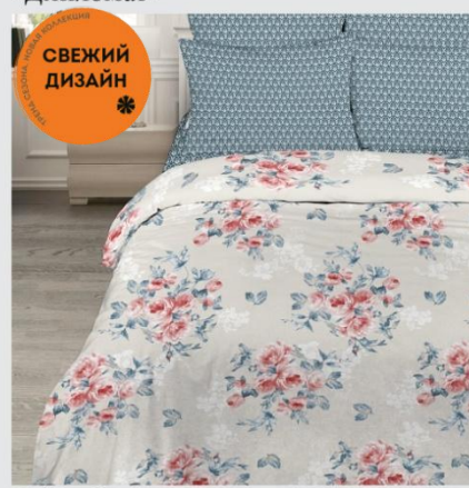
7140 «Стефания», вид 1