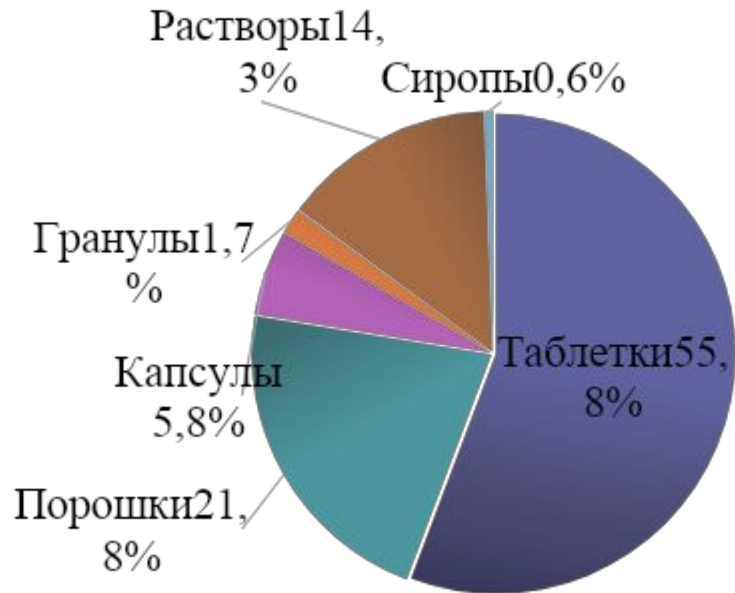
Рисунок 2 - Лекарственные формы противотуберкулезных лекарственных средств