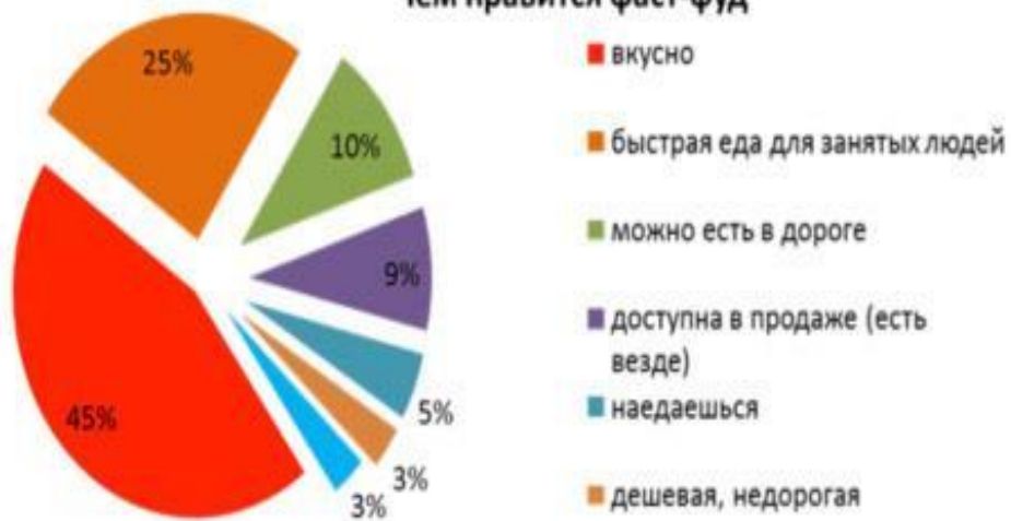
Чем нравится фаст-фуд