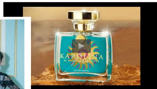
Каролина Куркова начала сотрудничество с международным брендом LR Health и выпустила косметическую линию под названием Karolina Kurkova. В