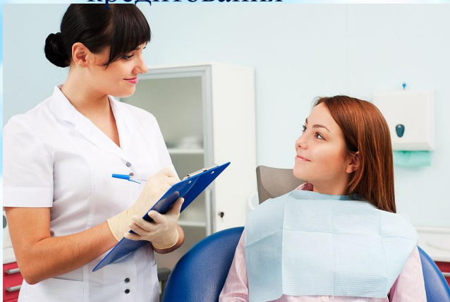
Программа добровольного медицинского страхования