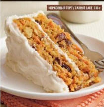
МОРКОВНЫЙ ТОРТ / CARROT CAKE 330P