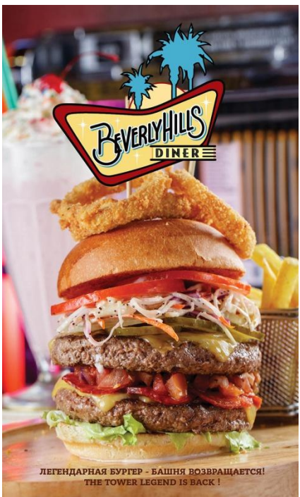
ЛЕГЕНДАРНАЯ БУРГЕР - БАШНЯ ВОЗВРАЩАЕТСЯ! THE TOWER LEGEND IS BACK!