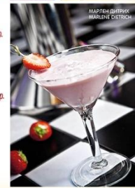
МАРЛЕН ДИТРИХ / MARLENE DIETRICH

Легенды на достижении сверхреализации праздника старинные напитки. Праздничные напитки являются неотъемлемой частью любого праздника.