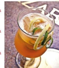
ЭЛИЗАБЕТ ТЯЛОД / ELIZABETH TAYLOR

МАРЛЕН ДИТРИХ MARLENE DIETRICH Бренди, ликер черной смородины, сливки, гранди. Brandy, liqueur black currant, whipped cream, granadine 290P