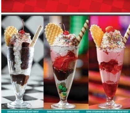
САХАРНО-КОРЕС ОРИЕНТАЛ ПАРАФАТ ПАРАФА СУШЕНЫЙ МЯТ / VANILLA PARFAТ ПАРАФА КЛУБНИЧНОЙ МЕНТА СТАВЕРБИТ ДЕСАЙН ПАРАФАТ