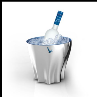
ВЕДРА для охлаждения