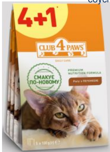
Клуб Коти паучі з печінкою