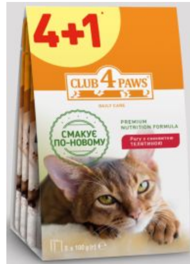
Клуб Коти паучі з телятиною