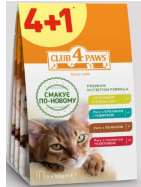
Асорті (Клуб Коти з кроликом в білому соусі , Клуб Коти з кроликом та індичкою ,Клуб Коти з печінкою Клуб Коти з телятиною 2 шт.)