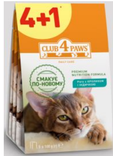
Клуб Коти паучі з кроликом та індичкою