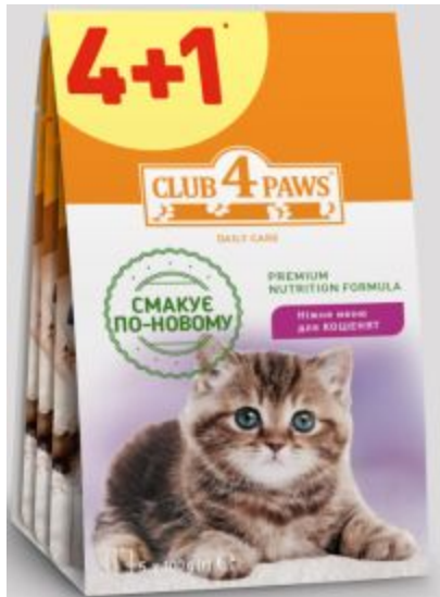
Клуб Коти паучі для кошенят