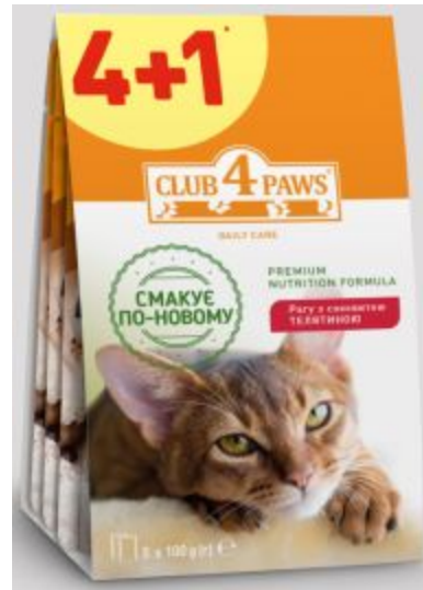
Клуб Коти паучі з телятиною