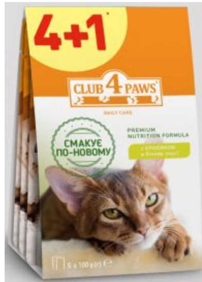
Клуб Коти паучі з кроликом в білому соусі