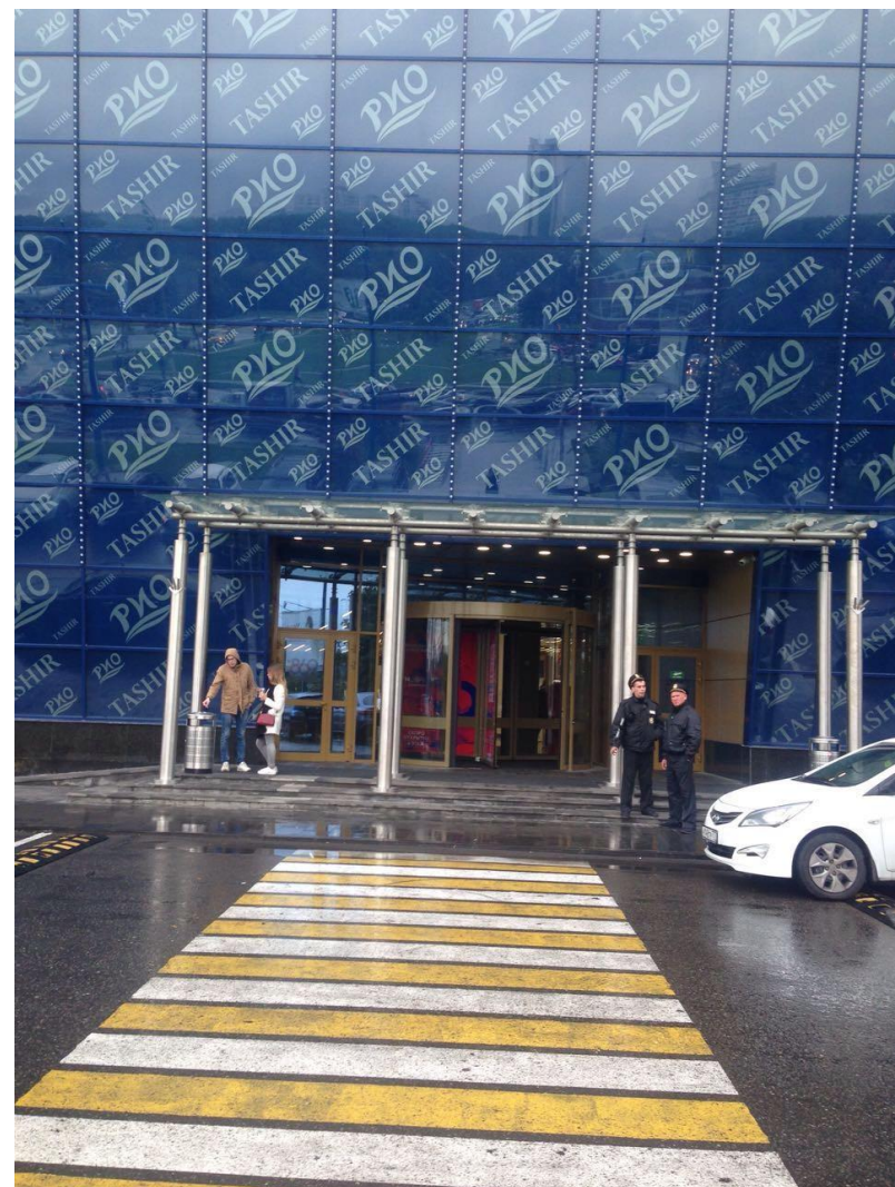
Фото входной группы и ТРЦ РИО Ленинский