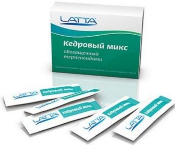
КЕДРОВЫЙ МИКС ОБОГАЩЕННЫЙ ТЕРПЕНОИДАМИ