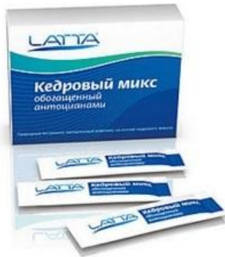
КЕДРОВЫЙ МИКС ОБОГАЩЕННЫЙ АНТОЦИАНАМИ