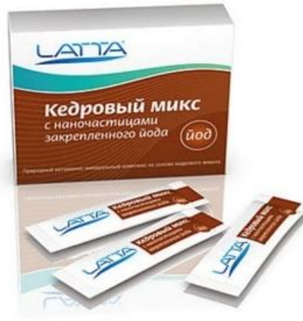
КЕДРОВЫЙ МИКС С НАНОЧАСТИЦАМИ ЙОДА