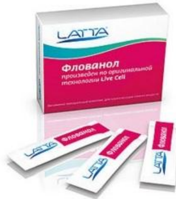
ФЛОВАНОЛ ПО ОРИГИНАЛЬНОЙ ТЕХНОЛОГИИ LIVECELL