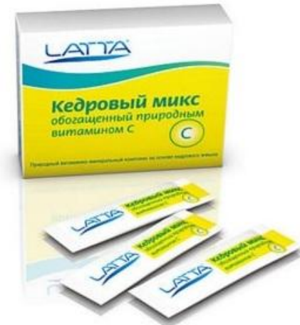
КЕДРОВЫЙ МИКС ОБОГАЩЕННЫЙ ПРИРОДНЫМ ВИТАМИНОМ С