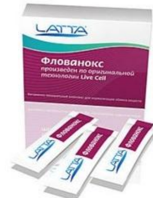
ФЛОВАНОКС ПО ОРИГИНАЛЬНОЙ ТЕХНОЛОГИИ LIVECELL