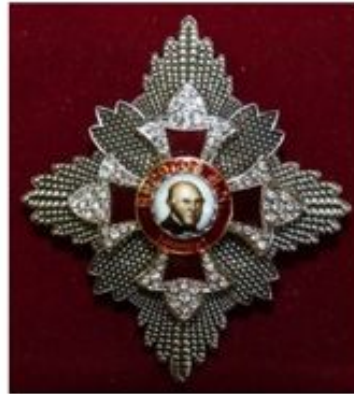
2011 г. Орден им. Пирогова Н.И. за разработку инновационного метода скрининг-диагностики «РОФЭС» и внедрении его в систему здравоохранения.