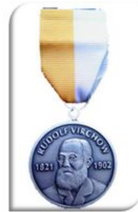
2012, Ганновер, Германия Медаль им. Рудольфа Вирхова Европейской Академии Естественных Наук – за разработку медицинской аппаратуры