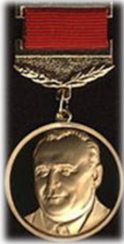
2010 г. Медаль им. С.П.Королёва «За вклад в развитие космонавтики»