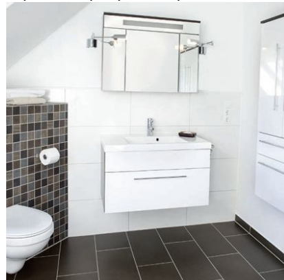
Готовая ванная комната. Швы заделаны затиркой SICHERHEITSFUGE FLEXIBEL.

На стены и на пол. Внутри и снаружи, а также под водой.