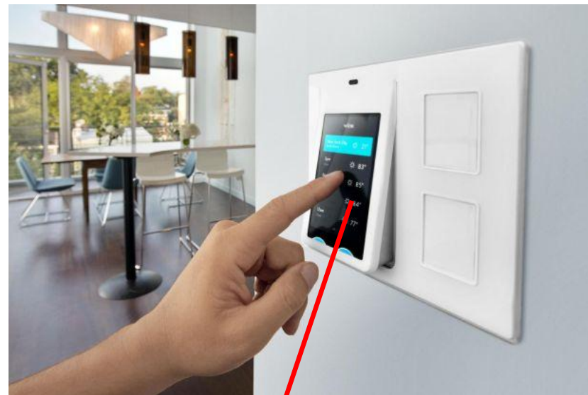
Пульт управления системой поиска