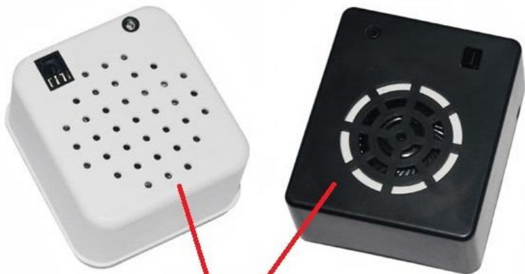
Звуковые микро-чипы "FIND" в черном и белом цвете