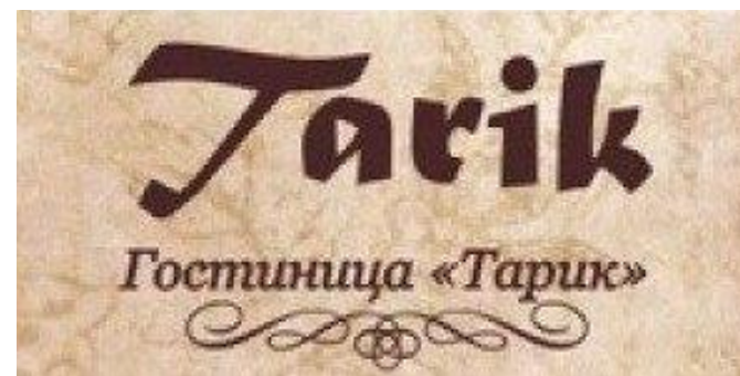
Гостиница «Tarik», Оренбург