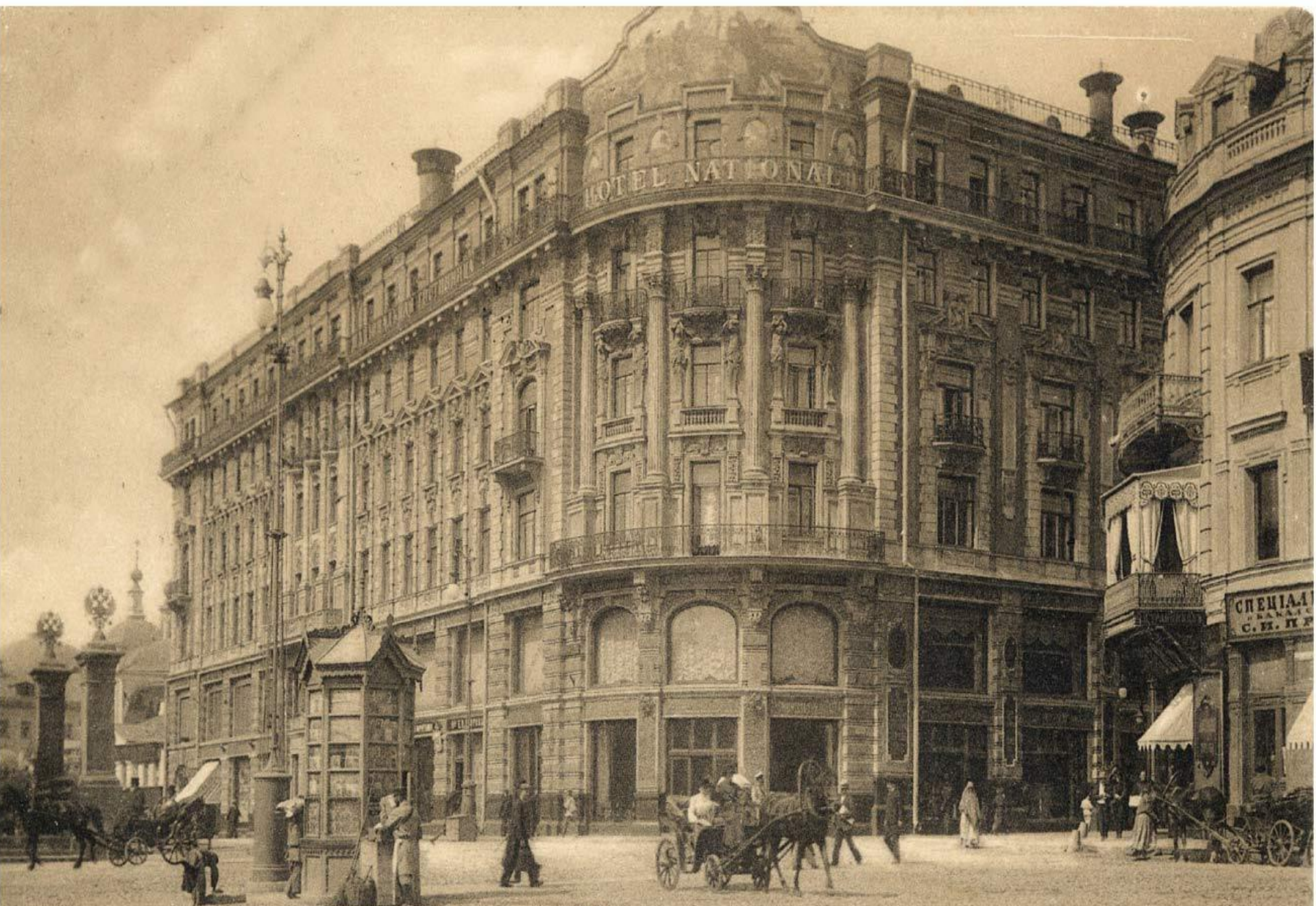
Москва - Moscow