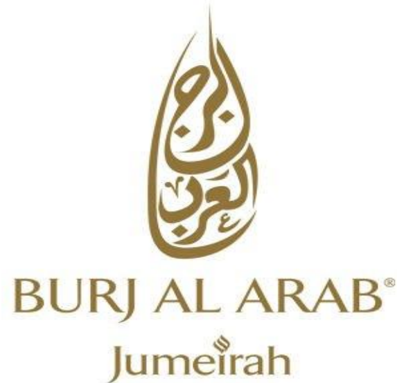
Отель «Burj Al Arab Jumeirah», Дубай