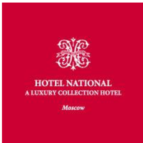
Гостиница «НАЦИОНАЛЬ», Москва