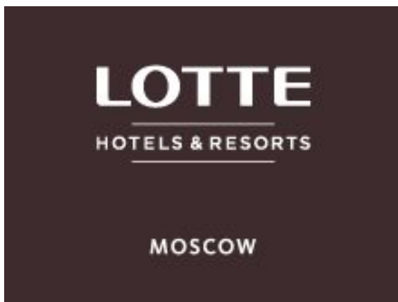
Гостиница «LOTTE», Москва