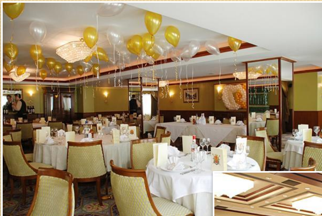
Банкетный зал «Петергоф»