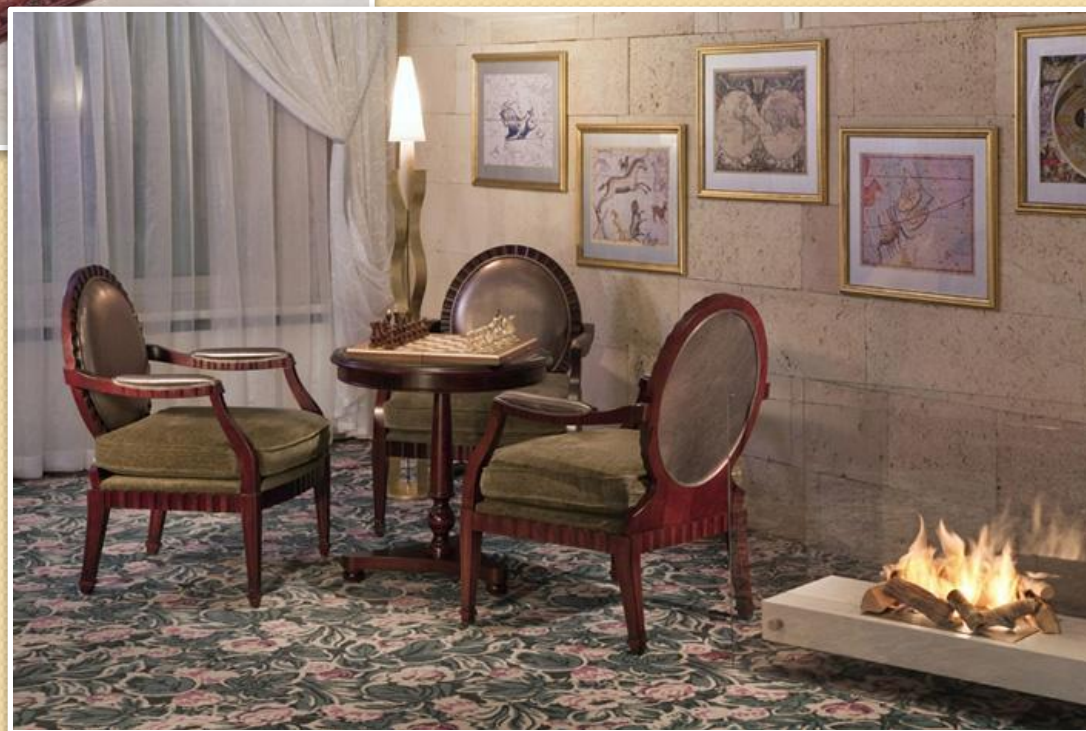
Бар «Аэростар Клуб»