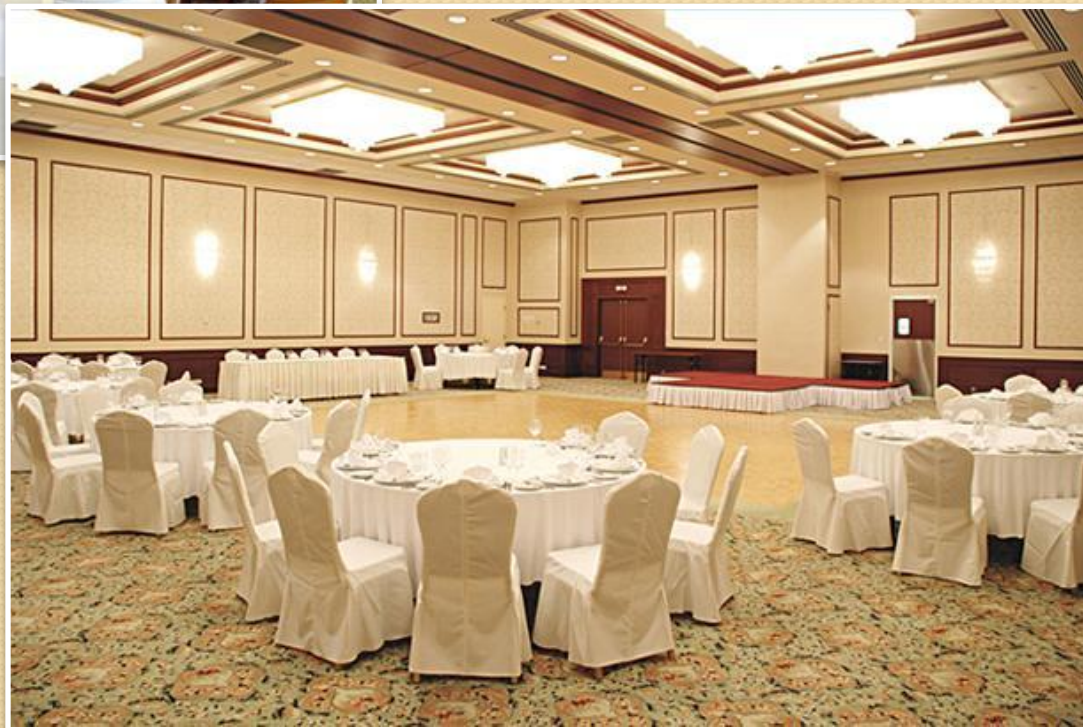
Банкетный зал «Петровский»