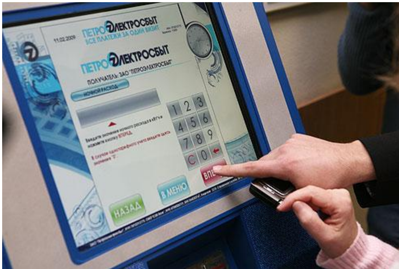
Пример настройки пользовательского экрана.