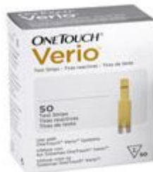
Тест-полоски OneTouch Verio® #50