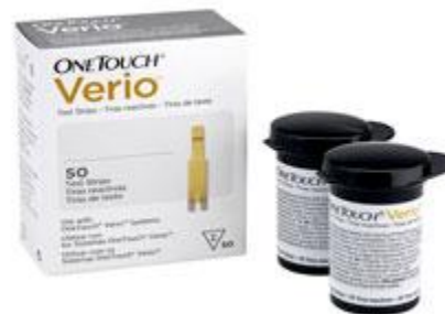
Тест-полоски OneTouch Verio® #100