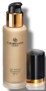
Антивозрастная тональная основа Коды 32047 - 32051