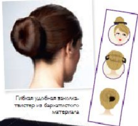
Гибкая удобная заколка-тигстер из бархатистого материала

Многофункциональная заколка. Для волос быстро и без особых усилий создай классический или другой стильный узел на каждый день. Материал: помпестер. Размер: 31 x 5 см.