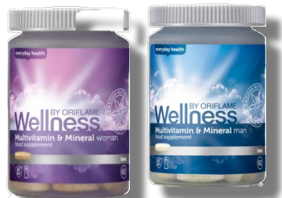
«Мультивитамины и минералы» для женщин Код 22794