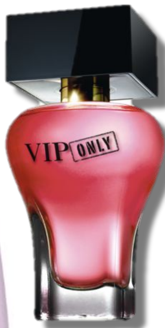
Парфюмерная вода Код 31998