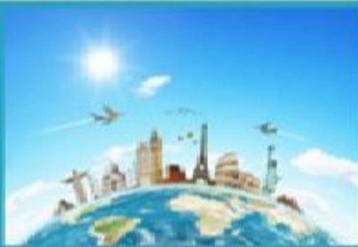
Әлем бойынша саяхат