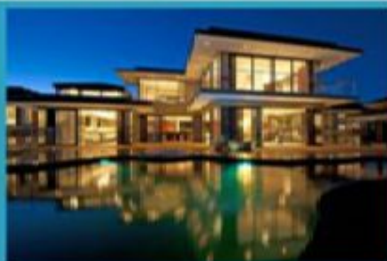
Әдемі үлкен үйіңіз