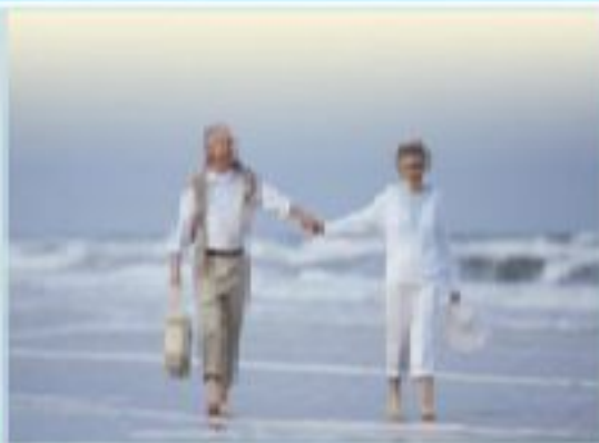
Бақытты кәрілік шақ