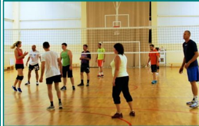
Аэробный и спортивный залы

Важно иметь при себе спортивную обувь и одежду для занятия спортом.