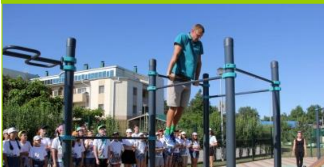
Спортивная площадка - воркаут