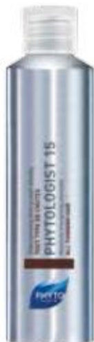
ТОНИЗИРУЮЩИЙ ШАМПУНЬ КОМПЛЕКСНОГО ДЕЙСТВИЯ PHYTOLOGIST 15