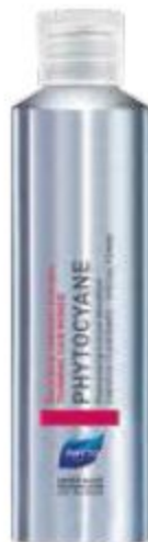
УПЛОТНЯЮЩИЙ ШАМПУНЬ ПРОТИВ ВЫПАДЕНИЯ ВОЛОС PHYTOCYANE