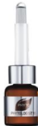
ЛАК С ПРОТЕИНАМИ ШЕЛКА

Первое комплексное средство против выпадения волос от лабораторий РНУТО, которое одновременно действует на 15 биологических факторов, ответственных за рост волос. Уменьшает выпадение волос, стимулирует рост новых более плотных волос при любом типе выпадения.