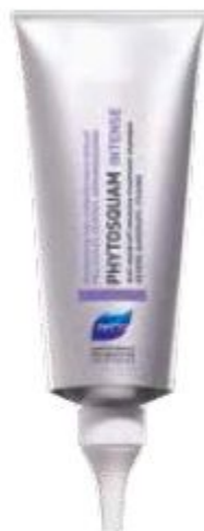
ШАМПУНЬ-УХОД ОТ ПЕРХОТИ ИНТЕНСИВНЫЙ