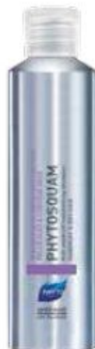
ШАМПУНЬ ОТ ПЕРХОТИ УВЛАЖНЯЮЩИЙ

Шампунь-уход обладает двойной эффективностью благодаря содержанию натуральных активных компонентов. Он обеспечивает высокую эффективность против перхоти и безупречный эффект красоты волос. Уникальная текстура позволяет наносить его непосредственно на кожу головы. При контакте с водой он преобразуется в пену, быстро удаляет перхоть, мгновенно устраняя ощущение дискомфорта. Применять в период обострения 2-3 раза в неделю в течение 2 недель.