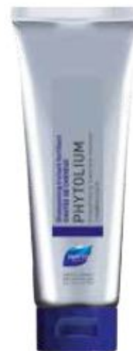
УКРЕПЛЯЮЩИЙ ШАМПУНЬ ПРОТИВ ВЫПАДЕНИЯ ВОЛОС PHYTOLIUM