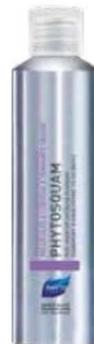
ШАМПУНЬ ОТ ПЕРХОТИ ОЧИЩАЮЩИЙ

Применять в период стабилизации 2-3 раза в неделю, чередуя с шампунем ФИТОСКВАМ ИНТЕНС