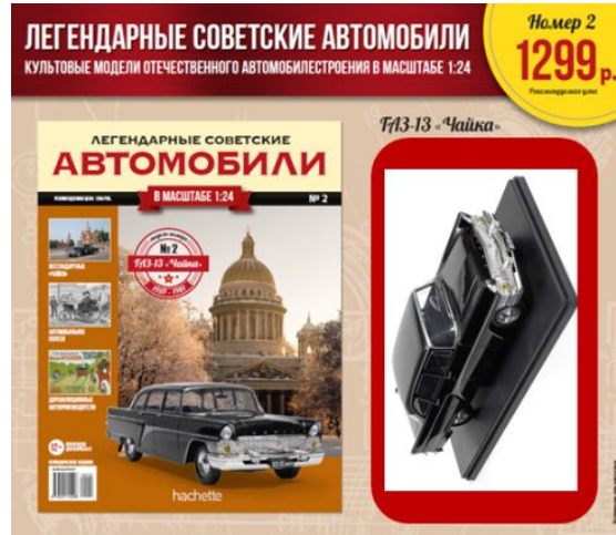
№2 - 1299