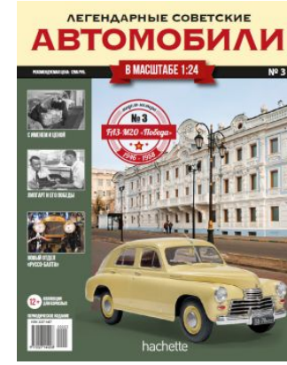
№3 - 1299