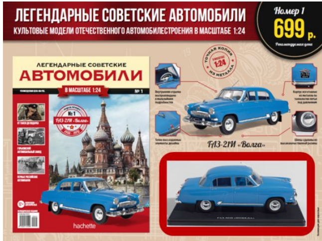
№1 - 699 р.