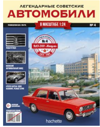
№4 - 1299