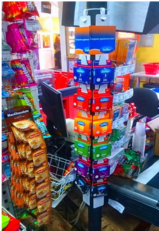
Страйп - ленты