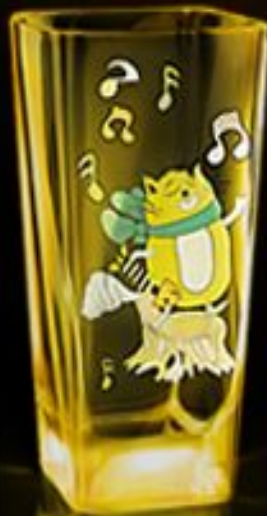
Souvenir glass (стакан)