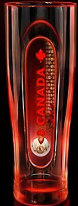
Beer (пивной бокал)