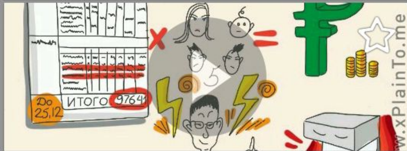
Свет и вода