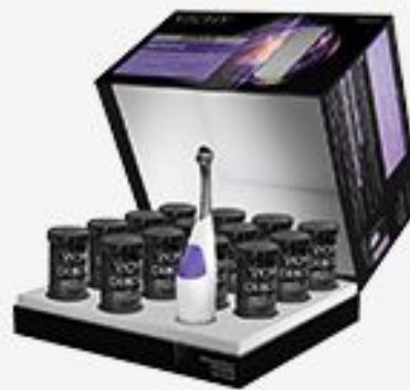
DERCOS NEOGENIC 1-OE СРЕДСТВО ДЛЯ РОСТА НОВЫХ ВОЛОС 28 ШТ