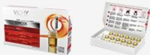
ИНТЕНСИВНОЕ СРЕДСТВО ПРОТИВ ВЫПАДЕНИЯ ВОЛОС VICHY DERCOS AMINEXIL PRO ДЛЯ ЖЕНЩИН 18 АМПУЛ