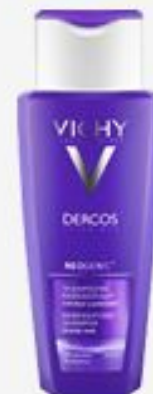
ШАМПУНЬ VICHY DERCOS NEOGENIC ДЛЯ ПОВЫШЕНИЯ ГУСТОТЫ ВОЛОС