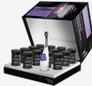
DERCOS NEOGENIC 1-OE СРЕДСТВО ДЛЯ РОСТА НОВЫХ ВОЛОС 28 ШТ