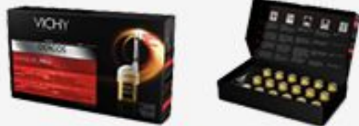
ИНТЕНСИВНОЕ СРЕДСТВО ПРОТИВ ВЫПАДЕНИЯ ВОЛОС VICHY DERCOS AMINEXIL PRO ДЛЯ МУЖЧИН, 18 АМПУЛ