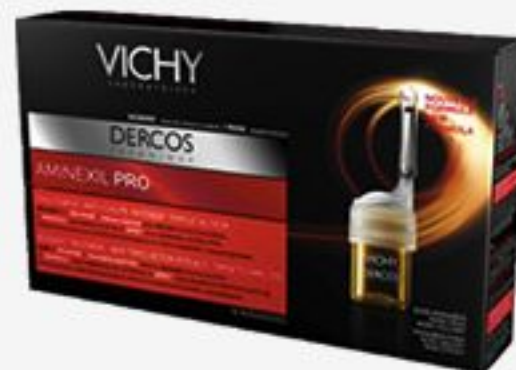
ИНТЕНСИВНОЕ СРЕДСТВО ПРОТИВ ВЫПАДЕНИЯ ВОЛОС VICHY DERCOS AMINEXIL PRO ДЛЯ МУЖЧИН, 12 АМПУЛ