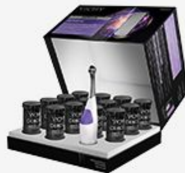
DERCOS NEOGENIC 1-OE СРЕДСТВО ДЛЯ РОСТА НОВЫХ ВОЛОС 28 ШТ