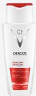
ТОНИЗИРУЮЩИЙ ШАМПУНЬ VICHY DERCOS ПРОТИВ ВЫПАДЕНИЯ ВОЛОС