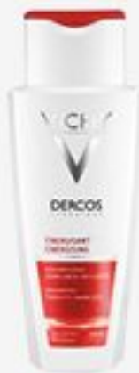
ТОНИЗИРУЮЩИЙ ШАМПУНЬ VICHY DERCOS ПРОТИВ ВЫПАДЕНИЯ ВОЛОС