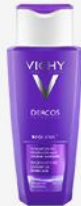
ШАМПУНЬ VICHY DERCOS NEOGENIC ДЛЯ ПОВЫШЕНИЯ ГУСТОТЫ ВОЛОС