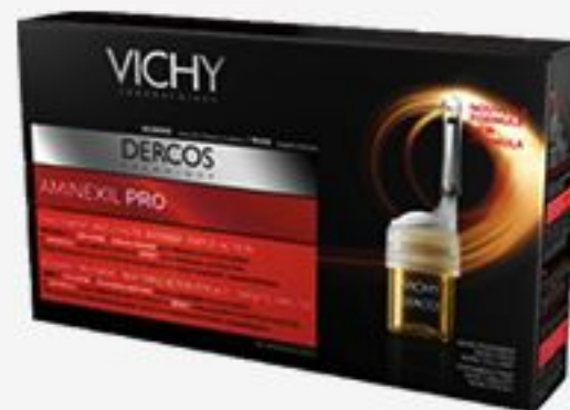
ИНТЕНСИВНОЕ СРЕДСТВО ПРОТИВ ВЫПАДЕНИЯ ВОЛОС VICHY DERCOS AMINEXIL PRO ДЛЯ МУЖЧИН, 12 АМПУЛ