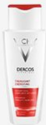
ТОНИЗИРУЮЩИЙ ШАМПУНЬ VICHY DERCOS ПРОТИВ ВЫПАДЕНИЯ ВОЛОС