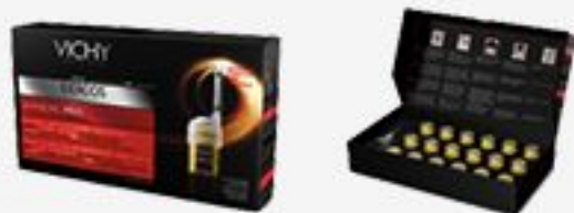
ИНТЕНСИВНОЕ СРЕДСТВО ПРОТИВ ВЫПАДЕНИЯ ВОЛОС VICHY DERCOS AMINEXIL PRO ДЛЯ МУЖЧИН, 18 АМПУЛ