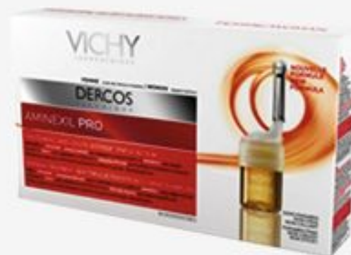
ИНТЕНСИВНОЕ СРЕДСТВО ПРОТИВ ВЫПАДЕНИЯ ВОЛОС VICHY DERCOS AMINEXIL PRO ДЛЯ ЖЕНЩИН, 12 АМПУЛ