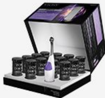
DERCOS NEOGENIC 1-OE СРЕДСТВО ДЛЯ РОСТА НОВЫХ ВОЛОС 28 ШТ