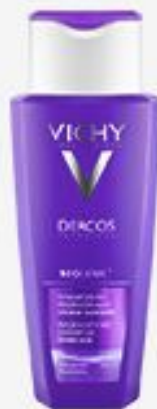
ШАМПУНЬ VICHY DERCOS NEOGENIC ДЛЯ ПОВЫШЕНИЯ ГУСТОТЫ ВОЛОС