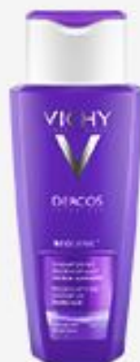
ШАМПУНЬ VICHY DERCOS NEOGENIC ДЛЯ ПОВЫШЕНИЯ ГУСТОТЫ ВОЛОС