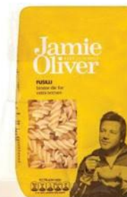
Паста «Фузилли» 5060170804193