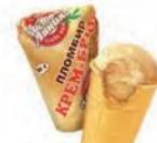
Пломбир крем-брюле в вафельном стаканчике (ручная вертка)