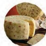
Качотта с красным перцем