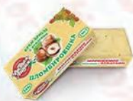
Пломбир крем-брюле с фундуком «Пломбируешка»