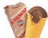
Пломбир шоколадный в вафельном стаканчике (ручная вертка)