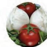
Моцарелла с тунцом и каперсами