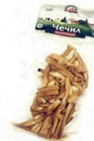
Чечил Спагетти копченый (отходы от резки)