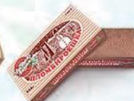
Пломбир шоколадный «Пломбируешка»