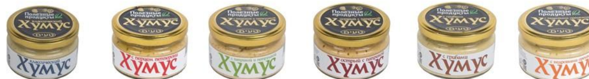
Хумус «Тайны Востока» классический