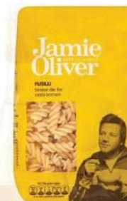
Паста «Фузилли» 5060170804193