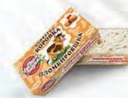
Пломбир с кусочками ириски «Пломбируешка»