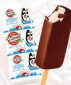
Эскимо «3 пингвина»