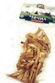
Чечил Спагетти копченый (отходы от резки)