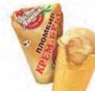
Пломбир крем-брюле в вафельном стаканчике (ручная вертка)