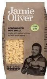
Паста «Конкильетте» мини-ракушки