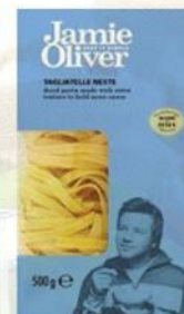
Паста «Тальятелле» зеленые