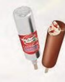
Эскимо «Российское» с кусочками клубники в шоколадной глазури