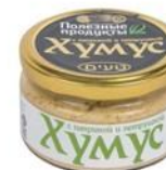
Хумус «Тайны Востока» с паприкой и петрушкой