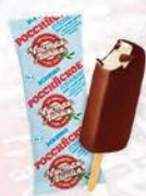
Эскимо «Российское» в шоколадной глазури (флоупак)