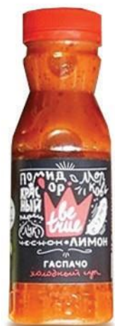
Холодный суп «Гаспачо»

Супы тоже могут быть вовсе не жирными, а полезными и вкусными. Только самые свежие овощи и натуральные компоненты, которые не только зарядят энергией, но и позволят не отказываться от вкусного первого блюда в условиях современного ритма жизни.