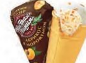
Пломбир с кусочками абрикоса в вафельном стаканчике (ручная вертка)