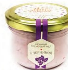
Кремовый мёд с черникой

Мед и корень имбиря — давно известные и широко применяемые народные средства. Они полезны для снятия симптомов простуды у детей. Компоненты обладают согревающим, противовоспалительным, антибактериальным и тонизирующим эффектом. Польза меда с имбирем огромна! При этом такое сочетание продуктов создает неповторимый пряный вкус и аромат, а его нежная консистенция превращает мед в необычное и очень полезное лакомство.