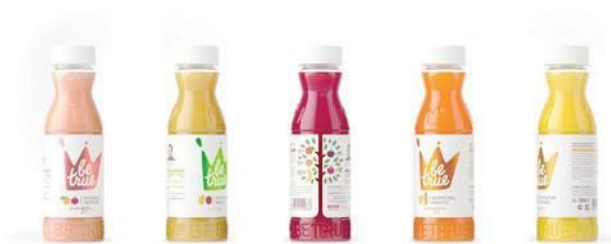
Питьевое пюре смузи «Клубника и банан»