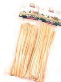
Чечил Спагетти копченый