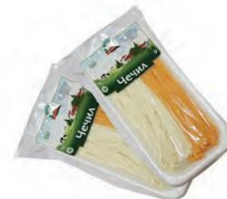
Чечил Ассорти (лоток)