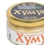
Хумус «Тайны Востока» с кедровыми орехами