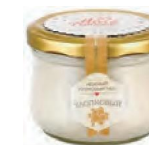
Крем-мед с ягодами годжи