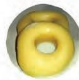
Чамбелла со вкусом копчения