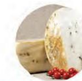
Качотта с черным перцем