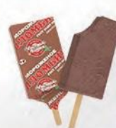
Эскимо пломбир шоколадный (в пергаменте)