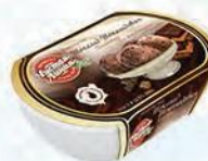
Пломбир шоколадный «Пломби́роешка»