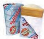
Пломбир в вафельном стаканчике