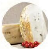
Качотта с черным перцем

Все сыры «Россини» производятся в Туле по традиционным итальянским рецептам, исключительно вручную и только из натурального экологически чистого молока. Главный секрет отличного вкуса — высочайшее качество ингредиентов, без сухого молока, пальмового масла, загустителей, добавок, усилителей вкуса и прочих химических компонентов.