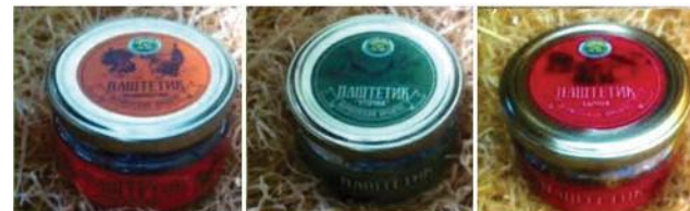
Паштет «Индюшечка» из печени индейки