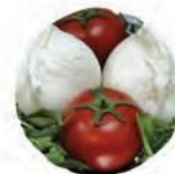
Моцарелла с оливками и грибами