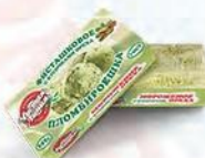
Пломбир с фисташкой «Пломбируешка»