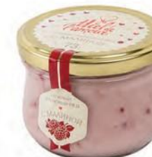
Кремовый мёд с малиной

Цветочный мед обладает ярким ароматом и сладко-нежным послевкусием. Черника же отличается пряно-сладким привкусом, а в сочетании с нежным кремовым медом делает его вкус неповторимым. За счет своей невероятной кремовой консистенции этот мед является не только источником полезных для здоровья микроэлементов, но и необычным лакомством. Попробуйте добавить его в домашнюю выпечку или просто намажьте на тосты.