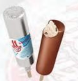
Эскимо «11 копеек» в шоколадной глазури