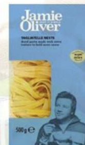
Паста «Тальятелле» зеленые