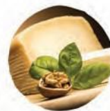
Вакино качотта с орехом