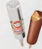
Эскимо «Российское» крем-брюле в шоколадной глазури