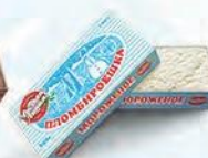
Пломбир ванильный «Пломбируешка»