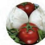
Моцарелла с тунцом и каперсами