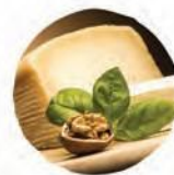
Вакино качотта с оливками