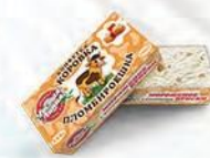
Пломбир с кусочками ириски «Пломбируешка»