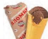
Пломбир шоколадный в вафельном стаканчике (ручная вертка)