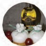
Буррата с красной икрой