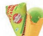
Пломбир фисташковый в вафельном стаканчике (ручная вертка)