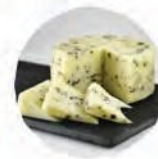
Качотта с оливками