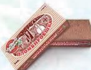
Пломбир шоколадный «Пломбируешка»