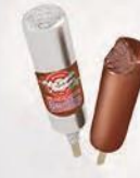
Эскимо «Российское» шоколадное в шоколадной глазури