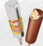
Эскимо «Российское» с кусочками абрикоса в шоколадной глазури