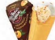
Пломбир с кусочками абрикоса в вафельном стаканчике (ручная вертка)