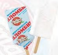
Эскимо пломбир ванильный (в пергаменте)