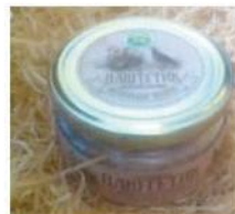
Паштет «Кабанчик» из свиной печени

Продукция «Калужичи» содержит только мясо и натуральные специи. Поставщик гарантирует здоровье, качество и вкус мясных деликатесов. Ведь они не содержат ГМО! Здесь осуществляют строгий контроль качества производимых продуктов на каждом этапе производства — от выбора сырья до упаковки в удобную, экологическую тару.