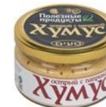
Хумус «Тайны Востока» острый с паприкой