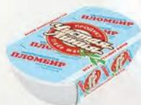
Пломбир ванильный «Пломби́роешка»