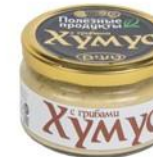
Хумус «Тайны Востока» с грибами