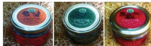
Паштет «Индюшечка» из печени индейки