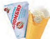
Пломбир в вафельном стаканчике (ручная вертка)