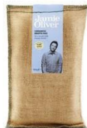
Рис «Карнароли» для ризотто