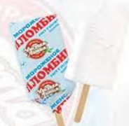
Эскимо пломбир ванильный (в пергаменте)