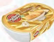
Пломбир крем-брюле «Пломби́роешка»