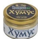
Хумус «Тайны Востока» классический