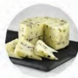
Вакино качотта с оливками