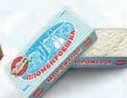
Пломбир ванильный «Пломбируешка»