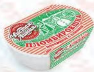
Пломбир с клюквой «Пломби́роешка»