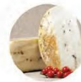
Вакино качотта с перцем