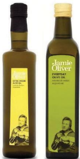
Оливковое масло Every Day Оливковое масло Extra virgin

С античных времен оливковое масло считается даром богов, лекарством, подаренным людям самой природой. И неслучайно жители Средиземноморья, регулярно употребляющие в пищу оливковое масло, сохраняют молодость, красоту и здоровье на долгие годы.