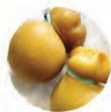
Скаморца со вкусом копчения

Все сыры «Россини» производятся в Туле по традиционным итальянским рецептам, исключительно вручную и только из натурального экологически чистого молока. Главный секрет отличного вкуса — высочайшее качество ингредиентов, без сухого молока, пальмового масла, загустителей, добавок, усилителей вкуса и прочих химических компонентов.