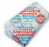
Пломбир ванильный в плоском вафельном стаканчике (ручная вертка)