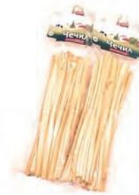
Чечил Спагетти копченый