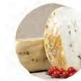
Качотта с черным перцем