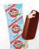
Эскимо «Российское» в шоколадной глазури