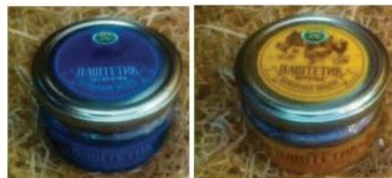
Паштет «Цесарочка» из печени цесарки

Продукция «Калужичи» содержит только мясо и натуральные специи. Поставщик гарантирует здоровье, качество и вкус мясных деликатесов. Ведь они не содержат ГМО! Здесь осуществляют строгий контроль качества производимых продуктов на каждом этапе производства — от выбора сырья до упаковки в удобную, экологическую тару.