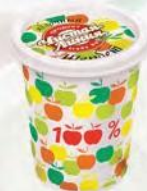
Щербет со вкусом вишни