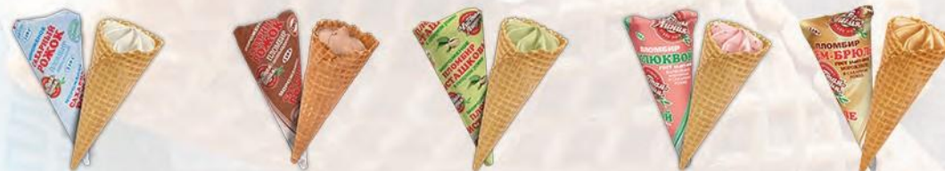
Сахарный рожок флау-пак