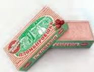
Пломбир с клюквой «Пломбируешка»