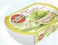
Пломбир с фисташкой