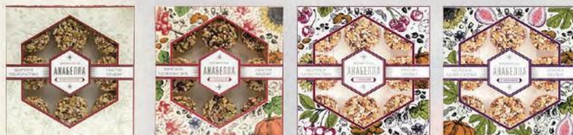
Биофитон «Анабелла» классический

Новинка на рынке здорового питания! Это продукт, приготовленный только из натуральных ингредиентов, без каких-либо добавок и содержит: миндаль, семена тыквы, подсолнуха, льна, кунжута и различные сухофрукты. Все эти компоненты исключительно полезны для каждого современного человека. Кроме того, это удивительно вкусно.