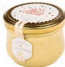
Кремовый мёд с прополисом

В силу сочетания в нем свойств богатого разнотравья и прополиса имеет необычный вкус: сладость меда и горчинку со смолистым привкусом прополиса, которые придают ему многогранный вкус, а также этот мед является сильным бактерицидным средством и отлично помогает при простуде. Мед с прополисом содержит большое количество витаминов, различных минералов и кислот.