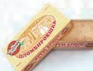
Пломбир крем-брюле «Пломбируешка»