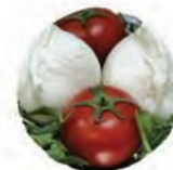
Моцарелла с оливками и грибами