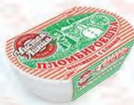
Пломбир с клюквой «Пломби́роешка»