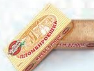
Пломбир крем-брюле «Пломбируешка»