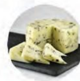
Качотта с оливками