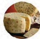
Качотта с красным перцем