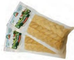
Чечил Косичка копченый