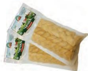
Чечил Косичка копченый