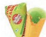
Пломбир фисташковый в вафельном стаканчике (ручная вертка)