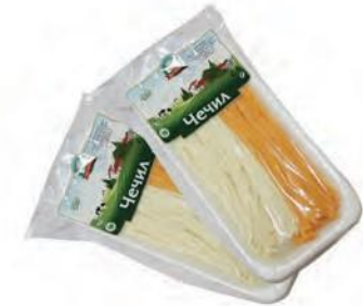
Чечил Ассорти (лоток)