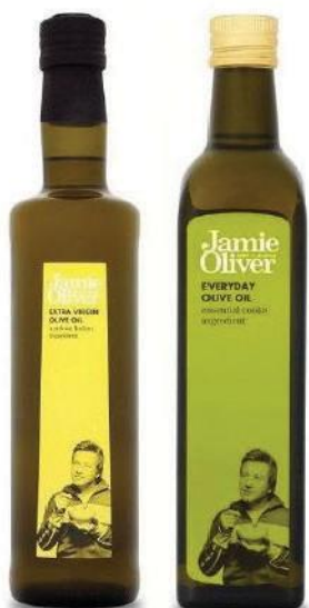
Оливковое масло Every Day Оливковое масло Extra virgin

С античных времен оливковое масло считается даром богов, лекарством, подаренным людям самой природой. И неслучайно жители Средиземноморья, регулярно употребляющие в пищу оливковое масло, сохраняют молодость, красоту и здоровье на долгие годы.