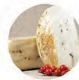
Вакино качотта с перцем