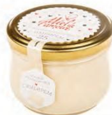
Кремовый мёд с имбирем

В силу сочетания в нем свойств богатого разнотравья и прополиса имеет необычный вкус: сладость меда и горчинку со смолистым привкусом прополиса, которые придают ему многогранный вкус, а также этот мед является сильным бактерицидным средством и отлично помогает при простуде. Мед с прополисом содержит большое количество витаминов, различных минералов и кислот.