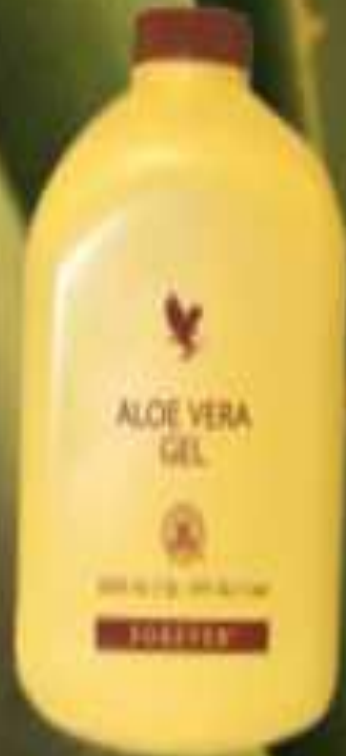
Гель Алоэ Вера

Наши Дистрибьюторы делятся идеей Форевр с людьми по всему миру. Нажмите здесь для того, чтобы увидеть разницу, которую наша продукция сможет привнести в вашу жизнь.