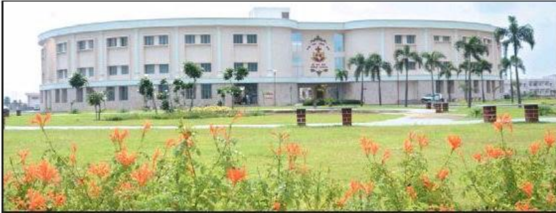
Shri Sathya Sai Sanjeevani Hospital building at Naya Raipur.