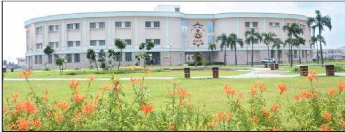
Shri Sathya Sai Sanjeevani Hospital building at Naya Raipur.