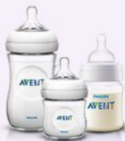
Детские бутылочки и соски