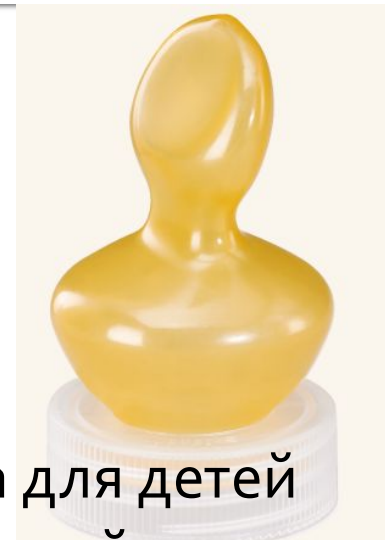
Соска для детей с расщелиной верхнего неба