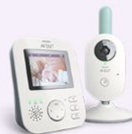
Радио- и видеоняни и термометры