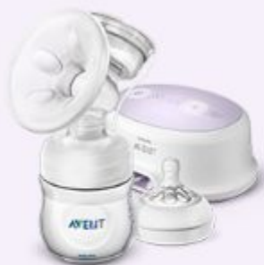
Молокоотсосы и уход за грудью