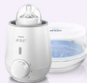
Подогреватели бутылочек и стерилизаторы