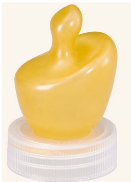
Соска для детей с расщелиной верхней губы

Благодаря широкому загубнику, хорошо закрывает дефект кожи и предотвращает заглатывание воздуха. Соска имеет отверстие, расположенное с небной стороны.