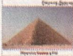
Великі Піраміди в Єгипті