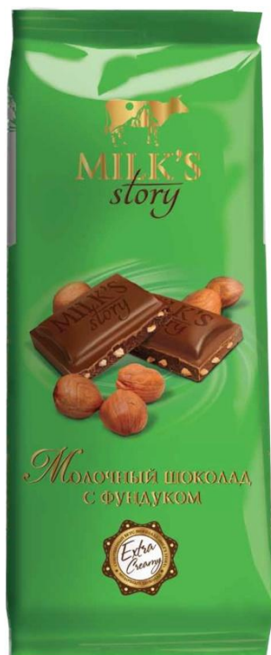
■ Шоколад Молочный с фундуком 90 гр

Молочный шоколад «Milk's story» обладает мягким нежным вкусом. Классический рецепт этого вида шоколада включает в себя какао масло тёртое, сливки или сухое молоко, чья жирность составляет не менее 25%, и сахарную пудру. Наш молочный шоколад содержит 32% какао. Специалисты нашей компании учли все предпочтения потребителей и разработали линейку шоколада с разными вкусами. Особой популярностью пользуется шоколад с тёртыми или дроблёными орехами, а любителям традиционного шоколада мы рады предложить молочный шоколад «Milk's story».