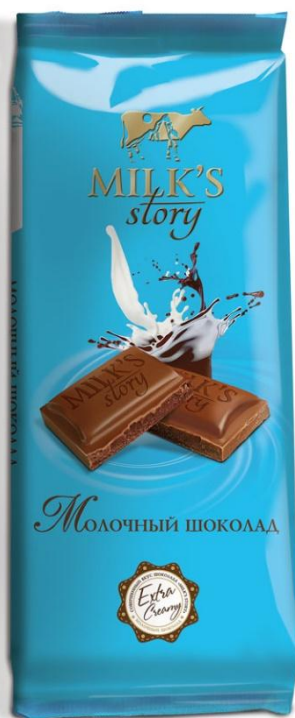
■ Шоколад Молочный 90 гр