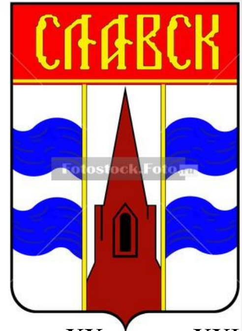
Герб конца XX-начале XXI века