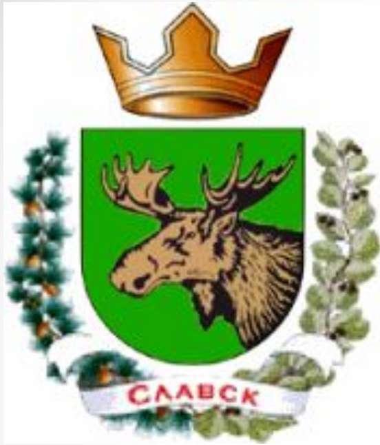
Герб Славского городского округа