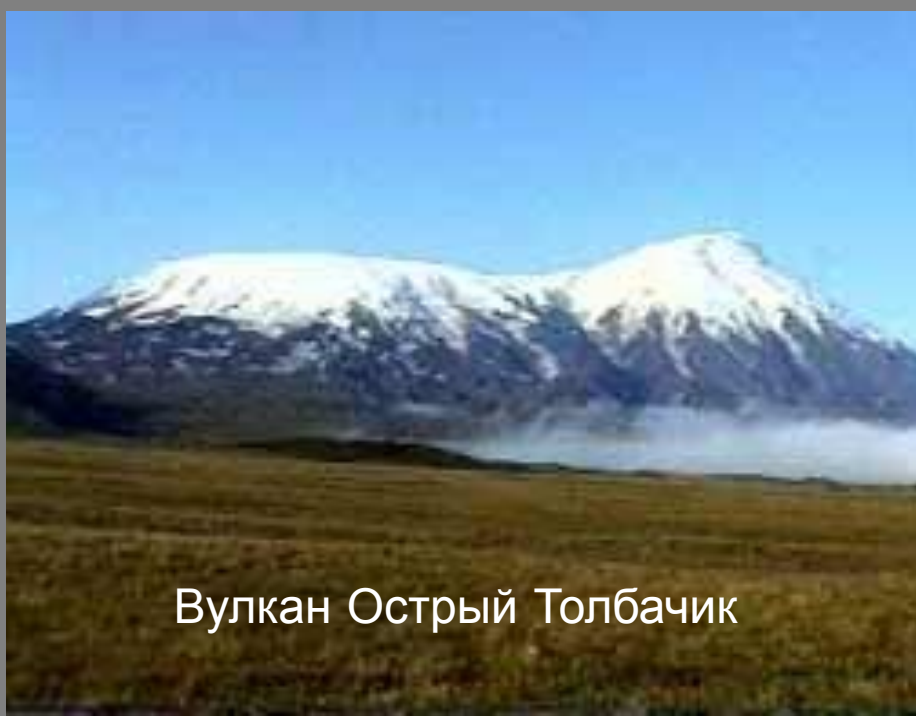
Вулкан Острый Толбачик