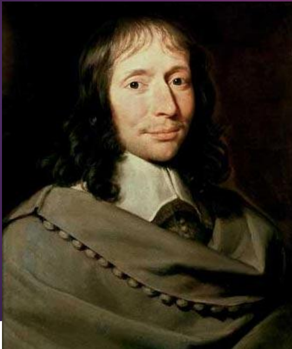
Блез Паскаль французский ученый 19.06.1623- 19.08.1662

Предмет математики настолько серьезен, что полезно не упускать случаев делать его немного занимательным