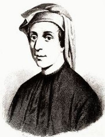
Леонардо Пизанский Leonardo Pisano

Леонардо Пизанский (1170 – 1250) - первый крупный математик средневековой Европы. Наиболее известен под прозвищем Фибоначчи.